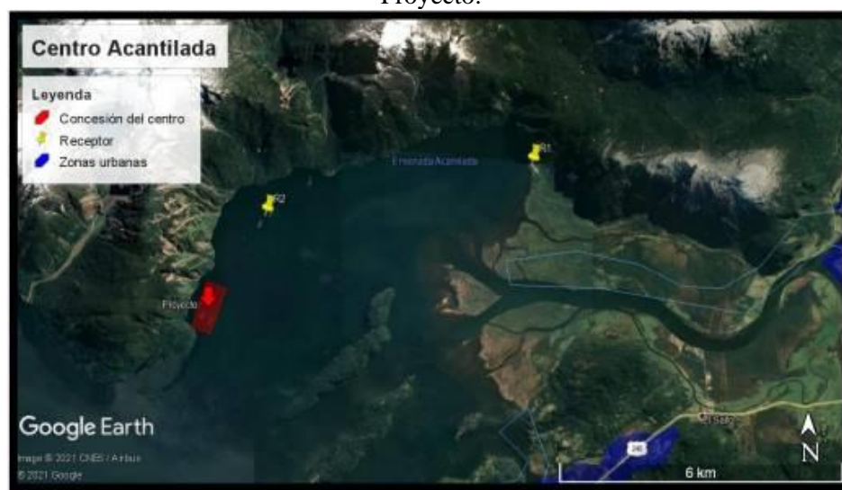
Figura 4, Anexo IIIc, de la Adenda: Vista satelital con la ubicación de los receptores y del Proyecto.

En la siguiente Tabla, se presenta un resumen de las áreas de influencia (distancia radial) obtenidas para cada fase del proyecto.