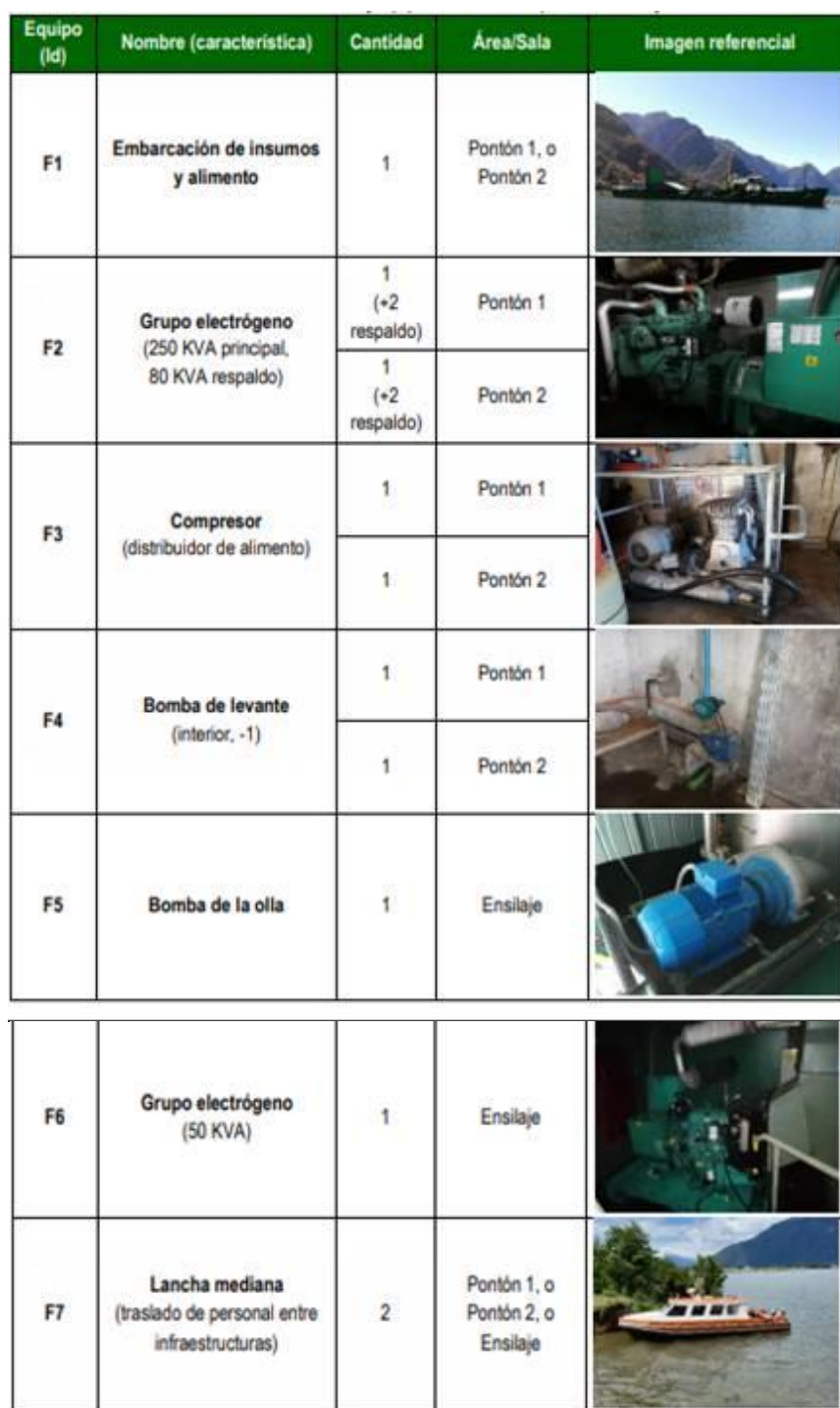
Tabla 3, Anexo IIIc.1, de la Adenda. Infraestructura y equipos de la fase de operación del Proyecto.

A continuación, se presentan los equipos considerados en la fase de operación del proyecto, para la estimación de ruido.