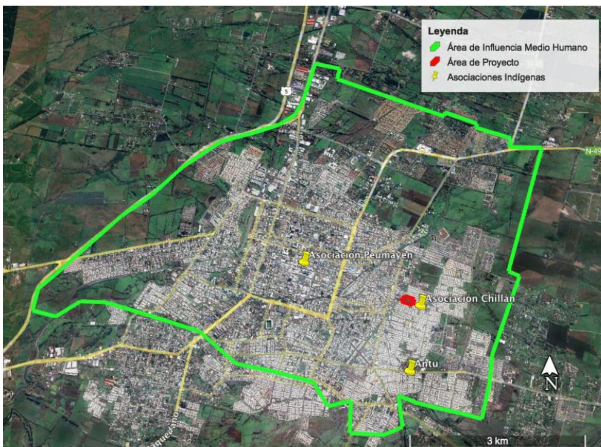
Figura: “Asociaciones indígenas en relación al área de proyecto”.