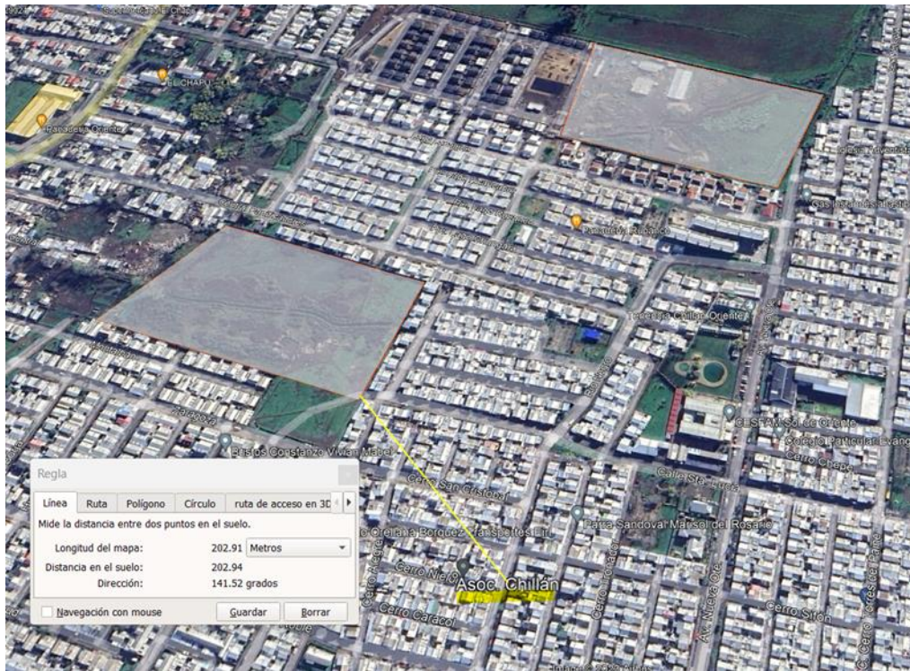
Imagen: Asociaciones indígenas en relación a Proyecto.