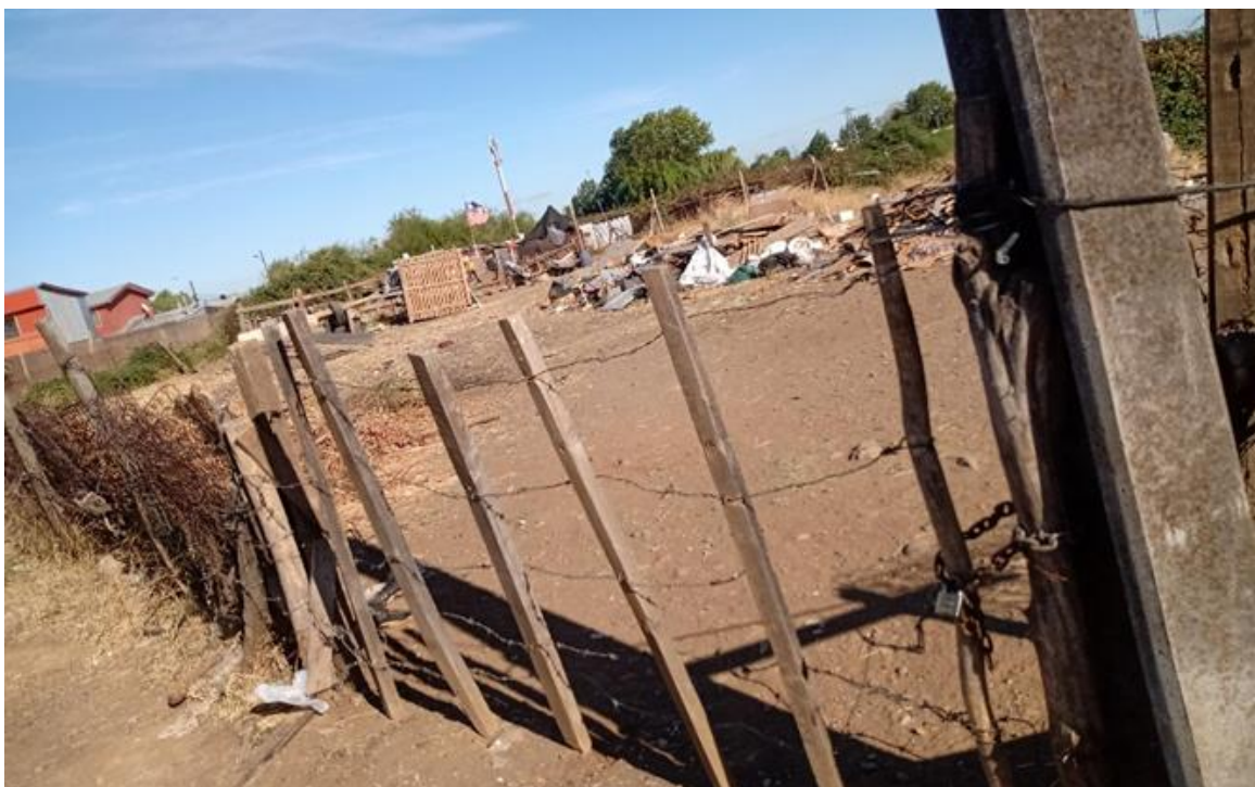
Imagen: Vivienda emplazada en el costado Sur del predio que posee un cierre perimetral y candado.