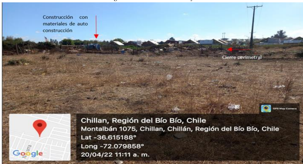
Imagen: Interior área de Proyecto