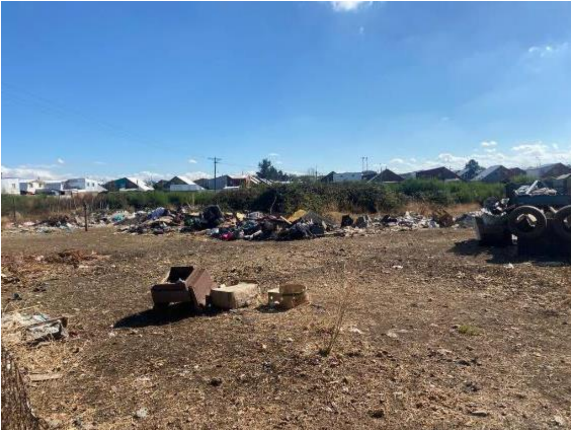
Imágenes: Interior área de Proyecto

En el caso del Anexo “CARACTERIZACIÓN DE MEDIO HUMANO DECLARACIÓN DE IMPACTO AMBIENTAL PROYECTO SANTA RUFINA, COMUNA DE CHILLÁN” del presente proyecto se indica en el punto 6.1. “Reasentamiento de comunidades humanas” que: “En la siguiente imagen se presente el área el estado actual del Proyecto a intervenir” adjuntando las siguientes imágenes: