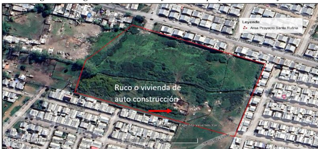
Imagen: “Vista general del área de influencia del proyecto “Santa Rufina”