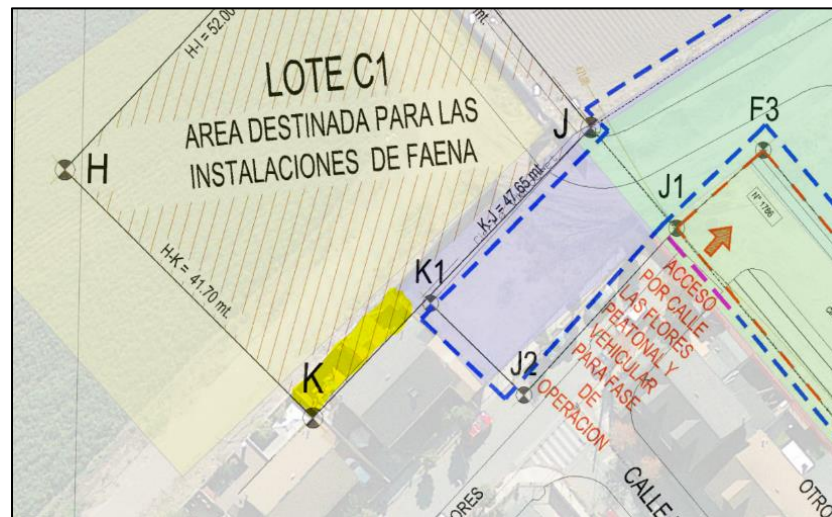
Figura 3: Intersección del área de IIFF con viviendas (en amarillo).

1.2.3. El archivo “EL ROSAL ORIENTE.kmz” muestra que el área destinada para las IIFF del Lote C1 se intercepta con las viviendas colindantes (ver en Figura 3 área resaltada en amarillo). Se solicita rectificar y dar claridad de los vértices de estas instalaciones.