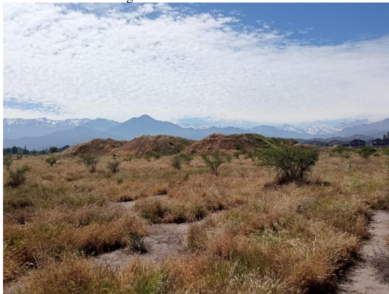
Figura 1: Montículos de tierra.

Fuente: Acta de terreno 202405106198, disponible en el expediente del Proyecto.