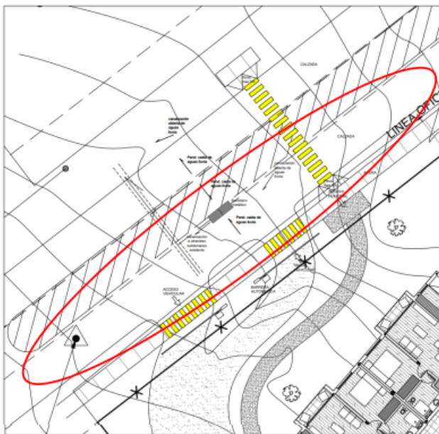
SITUACION PROPUESTA Esc. 1:200

Por lo cual se solicita presentar los antecedentes técnicos y ambientales del PAS respectivo.