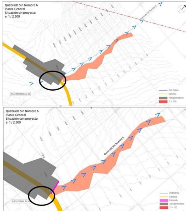
Figura 1. Modelaciones Hidráulicas con y sin proyecto Aerogenerador 40. Se observa (círculo negro) que el flujo tiene un origen en la obra, y no 100 m aguas arriba de este.

De acuerdo con estas figuras, el flujo modelado inicia en la misma ubicación de la obra, sin abarcar adecuadamente el tramo aguas arriba, quedando incluso parte de esta fuera del dominio modelado. Esta omisión impide evaluar si la obra proyectada (enrocado) resulta suficiente para enfrentar los caudales de escorrentía natural.