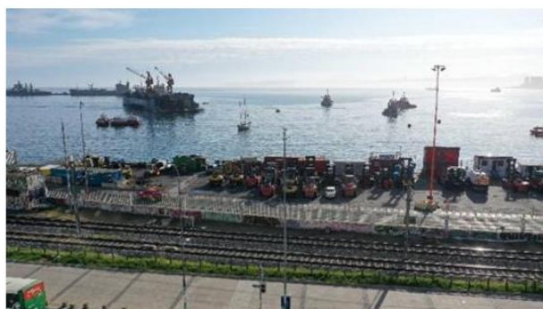
Foto 31 Vista actual desde edificio Duoc