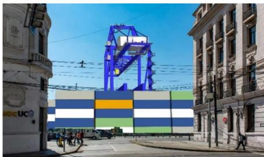
Foto 34. Impacto sitio Costanera en zona típica Juana Ross