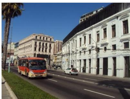
Foto 30. Edificio DUOC Cousiño, monumento Histórico.

“e) En el plan de la ciudad, en el sector de la Zona Típica de Juana Ross y dentro de la Zona de amortiguamiento del SPM, en Av. Errázuriz en el PO20, situado frente al DUOC Cousiño, Monumento Histórico, Foto 30, vemos la actual vista Foto 31 que ostenta la Av. principal y mejor vista como es Av. Errázuriz (que es el espacio público principal) y como se vería afectada con el T2 original y con el Sitio Costanera Foto 33, además de la afección al pasaje Ross Foto 34. Acá claramente se puede apreciar también que el impacto del Sitios Costanera será más adverso sobre el DUOC, SPM y Zona de Amortiguamiento por la concentración de grúas que genera esta ampliación portuaria vs el T2 original Foto 32 y 33.