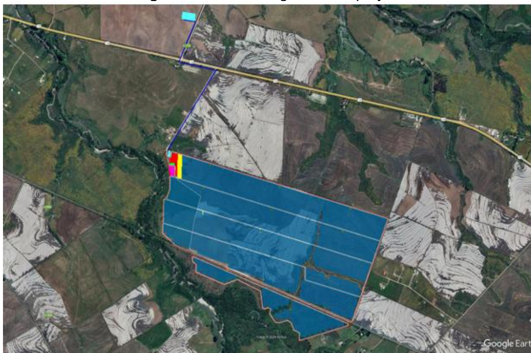
Imagen 1. Localización general del proyecto.

4.4.2. El Proyecto tendría una vida útil de 30 años, según el cronograma general de la Tabla 3 de la DIA, proyectándose la fase de cierre para el año 2055. Además, el área propuesta para el desarrollo de las instalaciones del Proyecto posee una superficie aproximada de 140 ha. La Imagen 1 muestra la distribución del Proyecto.