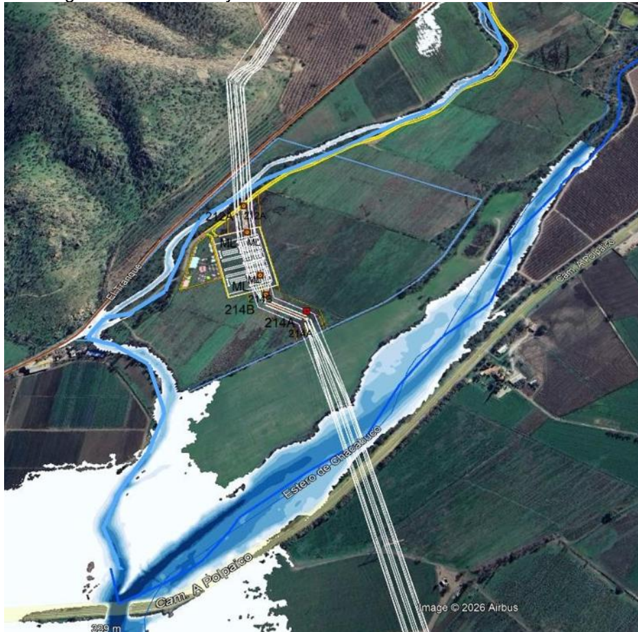
Figura 2: Red hídrica y área de modelación de la crecida centenaria