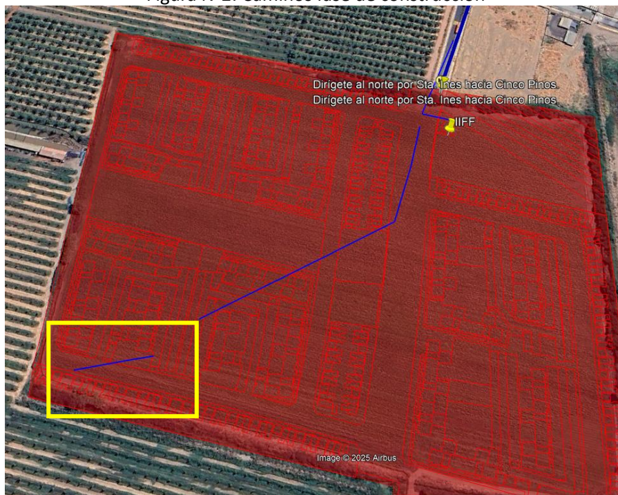
Figura N°2: Caminos fase de construcción