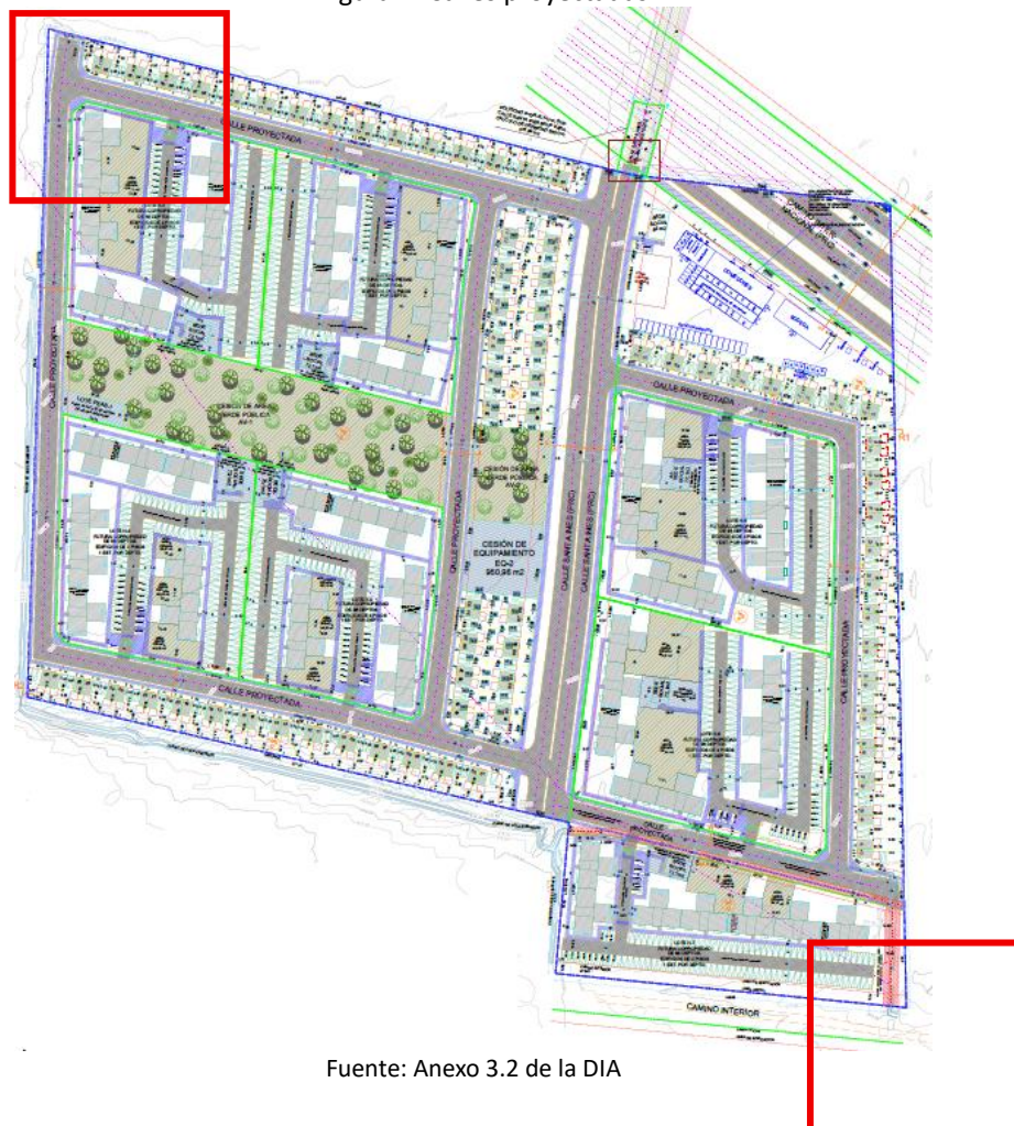
Figura 1: Calles proyectadas