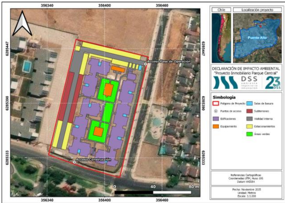
Figura 1.1. Puntos de acceso para fase de construcción y operación.

Sobre los accesos se aclara que se considera un acceso en fase de construcción por Avenida Parque Central y un acceso para fase de operación por la calle camino del agua, los puntos se muestran en la siguiente figura.